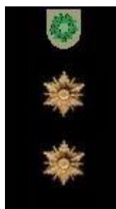
Policijas priekšnieka vietnieks