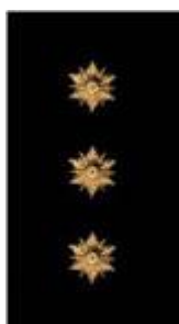
Policijas vecākais inspektors